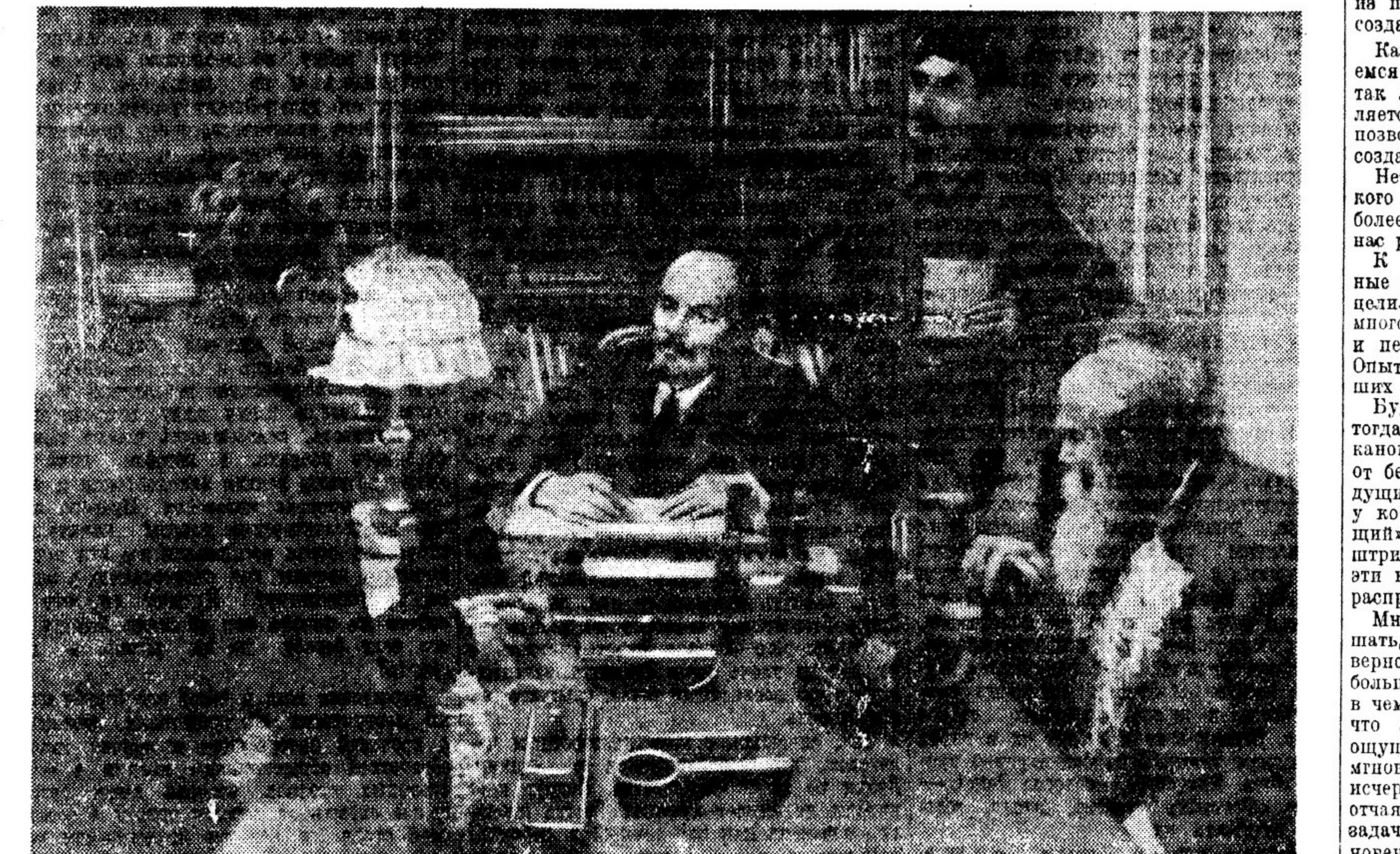
«ХОДОКИ-КРЕСТЬЯНЕ НА ПРИЕМЕ У В. И. ЛЕНИНА» Картина И. Грабара

ЛЕНИН. Так что же, товарищи, давайте поблагодарим мастера!